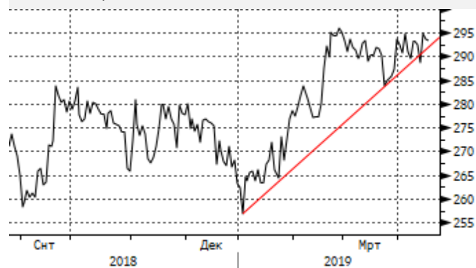
Медь: сопротивление на 296