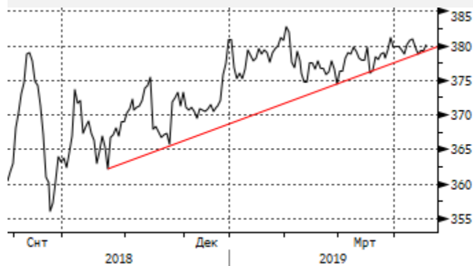
USDKZT: попытка пробития трендовой не удалась