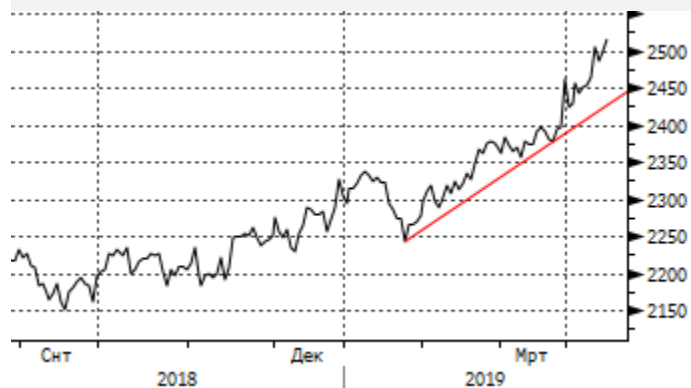
KASE: ретест отметки 2500