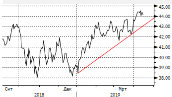
ЕМ: отскок вниз от 1100