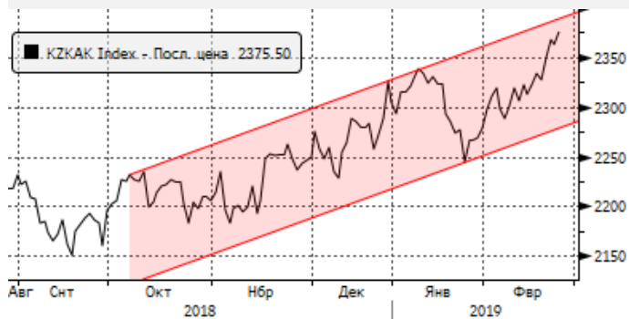
KASE: движение внутри канала