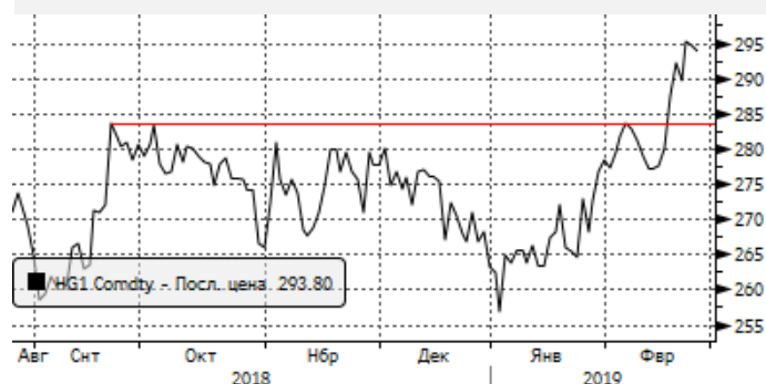
Медь: сопротивление на 296