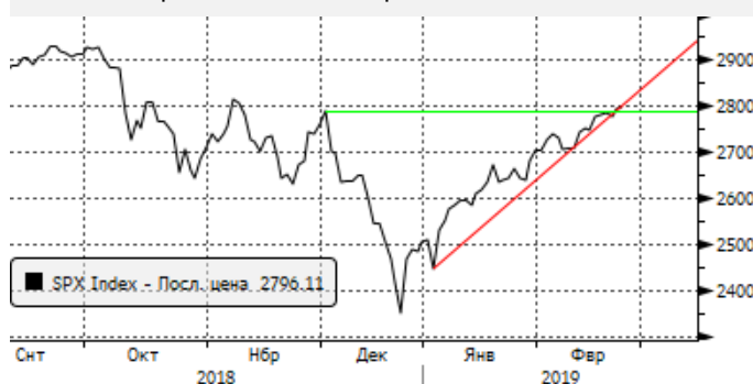
S&P500: продолжающийся рост