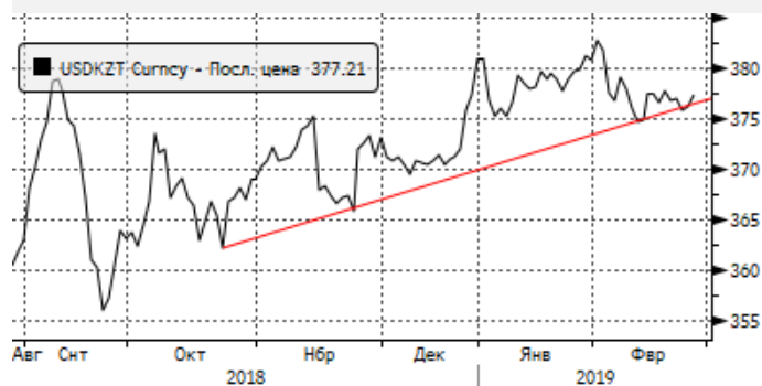
USDKZT: боковое движение