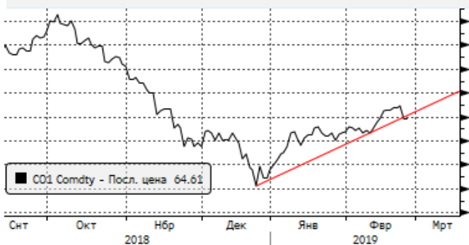
Нефть: пробой трендовой линии