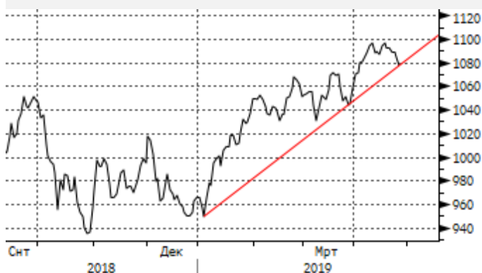
EM: отскок вниз от 1100