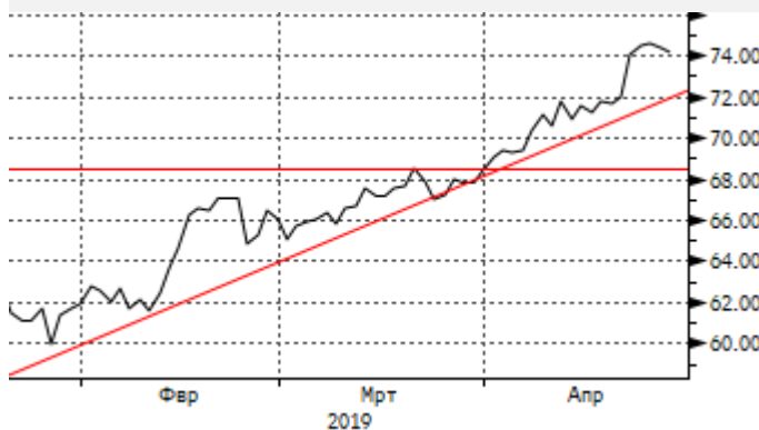
Нефть: движение по трендовой линии