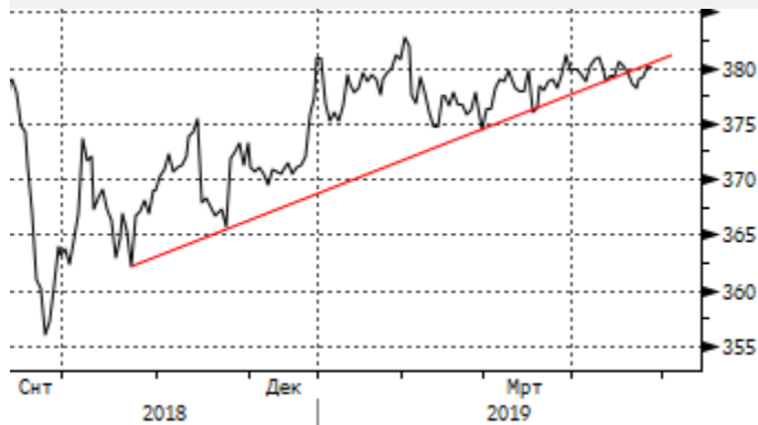
USDKZT: попытка пробоя трендовой линии