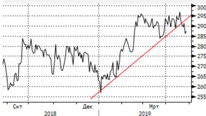
Медь: пробитие трендовой линии