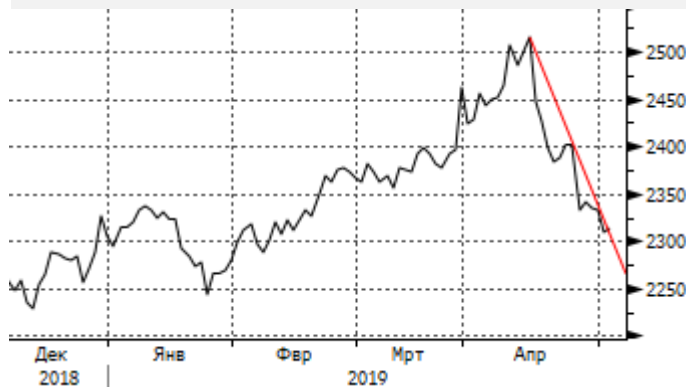
KASE: Возможно пробитие нисходящего тренда