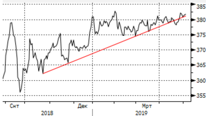
USDKZT: попытка пробоя трендовой не удалась