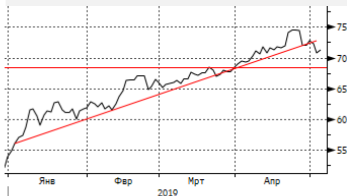
Нефть: пробой трендовой