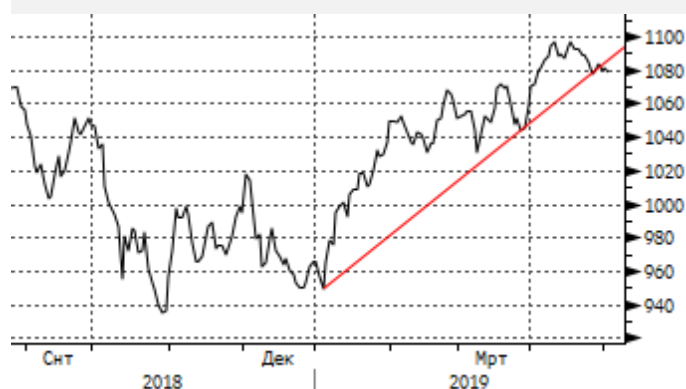
EM: отскок вниз от 1100