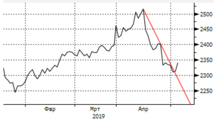
KASE: пробитие нисходящего тренда