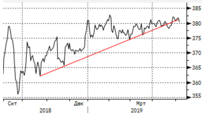
USDKZT: попытка пробоя трендовой не удалась