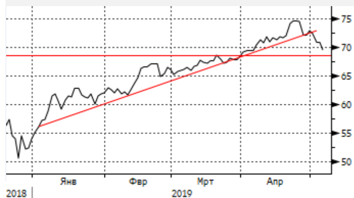
Нефть: пробой трендовой