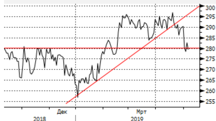
Медь: отскок от уровня 280