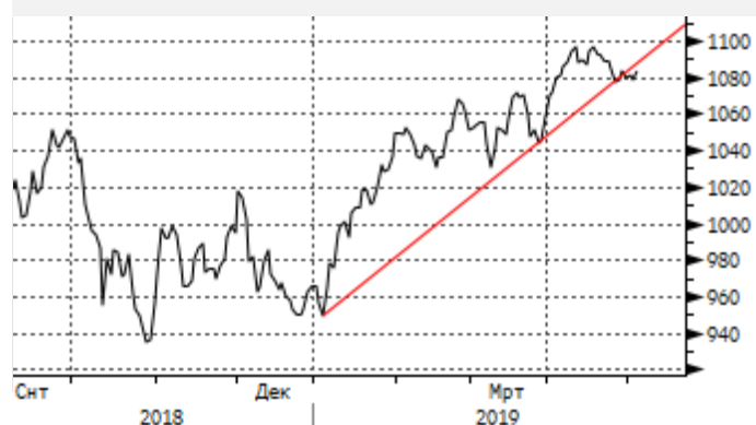
EM: отскок вниз от 1100