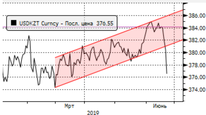
USDKZT: резкое укрепление