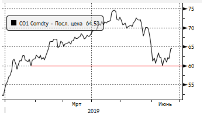
Нефть: пробой уровня 63,9