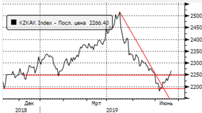
KASE: пробой сопротивления 2250