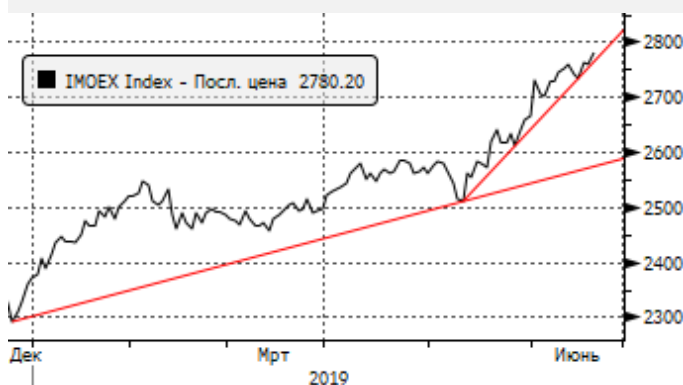
МОЕХ: отскок от трендовой