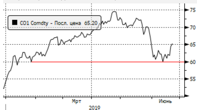
Нефть: пробой уровня 63,9 вверх