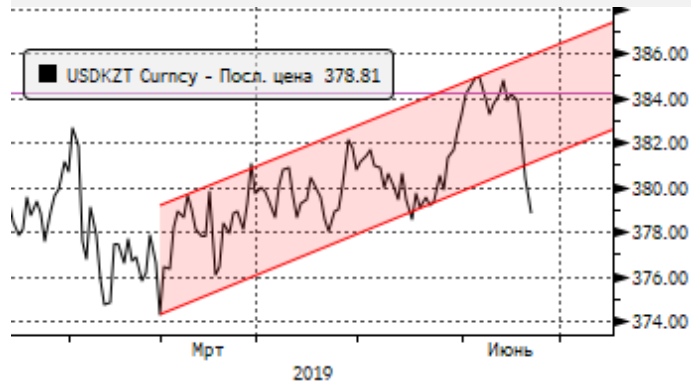
USDKZT: резкое укрепление