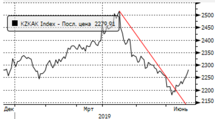
KASE: пробой сопротивления 2250