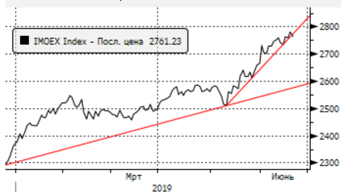
МОЕХ: отскок от трендовой