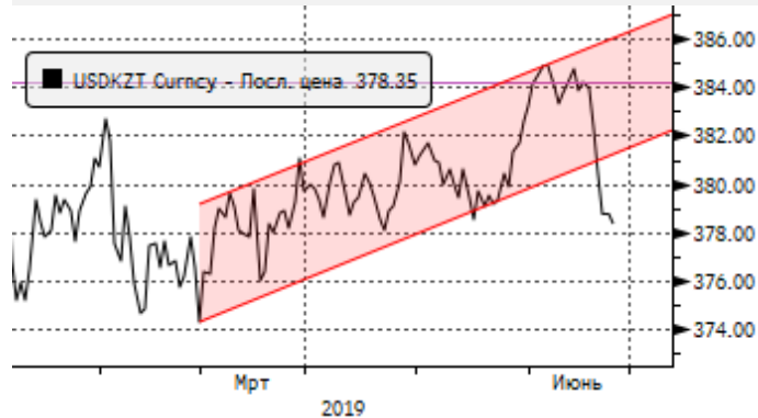
USDKZT: резкое укрепление