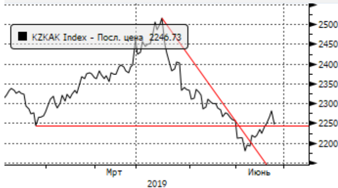
KASE: пробой сопротивления 2250