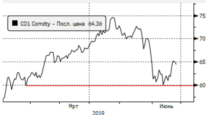
Нефть: пробой уровня 63,9 вверх