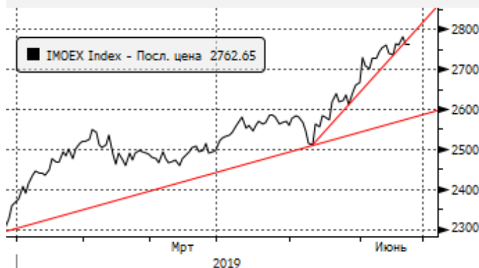
МОЕХ: отскок от трендовой