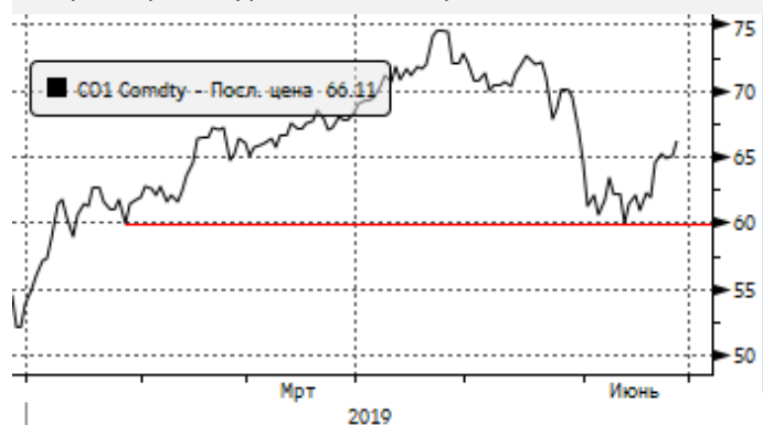
Нефть: пробой уровня 63,9 вверх