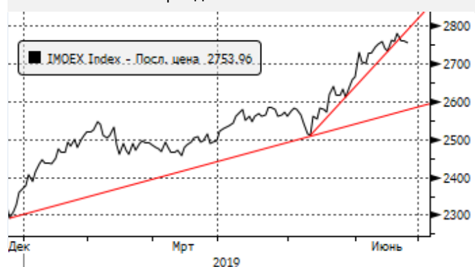
МОЕХ: отскок от трендовой