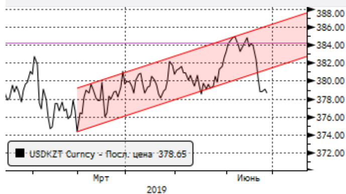
USDKZT: резкое укрепление