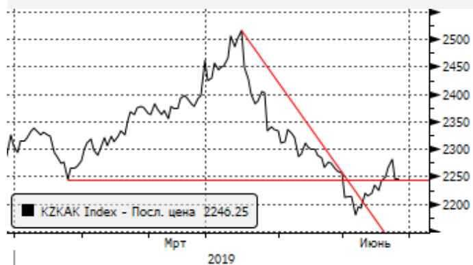
KASE: пробой сопротивления 2250