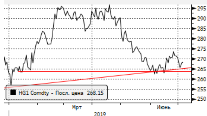
Медь: отскок от уровней поддержки