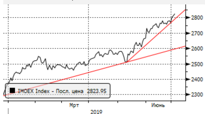
МОЕХ: отскок от трендовой