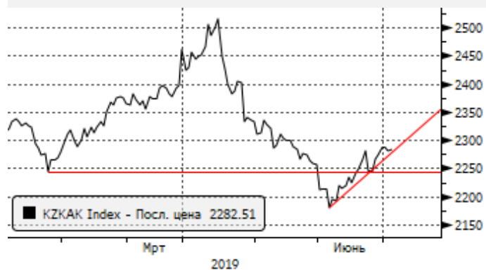
KASE: отскок от 2240