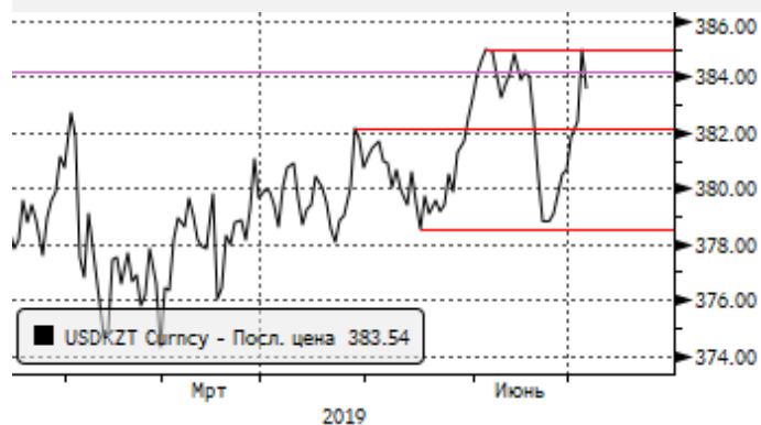
USDKZT: укрепление от 385