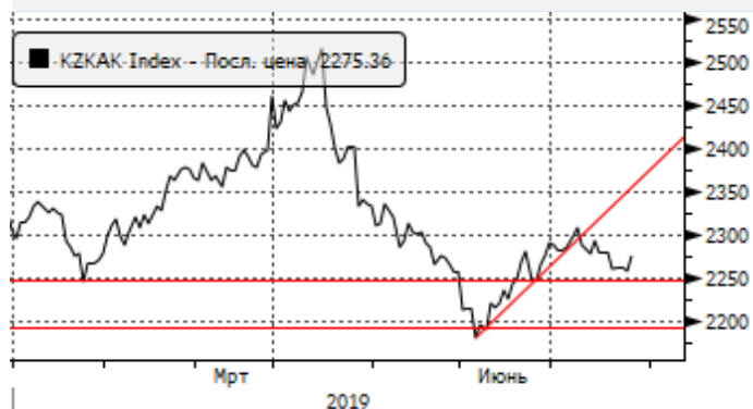
KASE: пробой трендовой