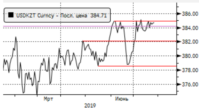
USDKZT: 385 – поддержка для тенге