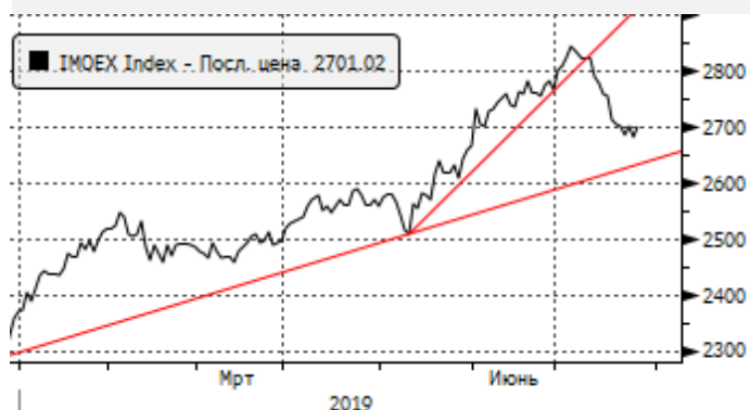
МОЕХ: пробой трендовой линии