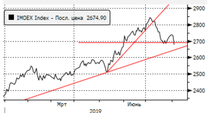
МОЕХ: снижение ниже 2700