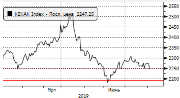
KASE: у уровня поддержки 2250