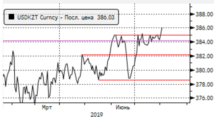
USDKZT: пробой уровня 385