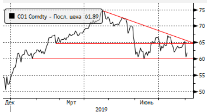
Нефть: снижение к $61