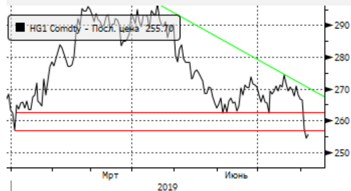
Медь: пробой уровня поддержки