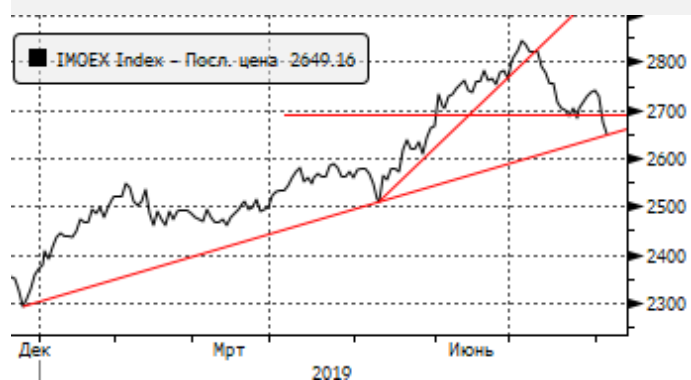
МОЕХ: снижение ниже 2700