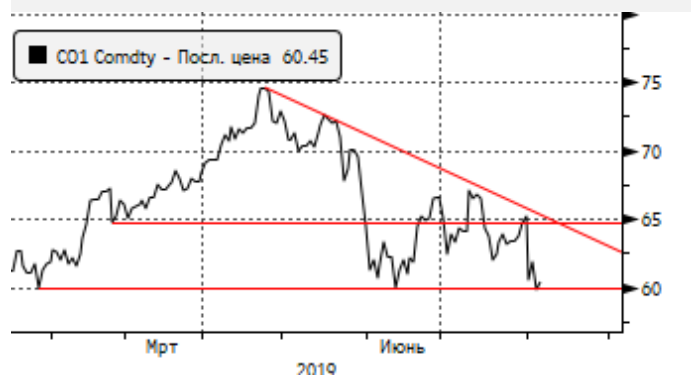
Нефть: снижение к $61