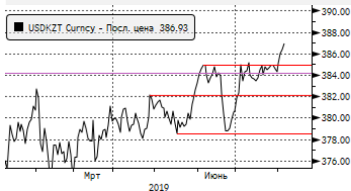
USDKZT: пробой уровня 385