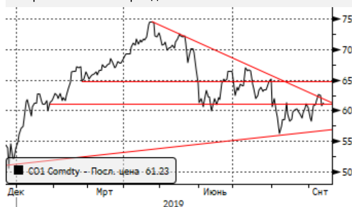
Нефть: Отскок от трендовой линии