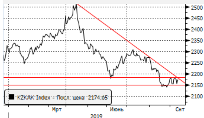
KASE: ретест уровня сопротивления