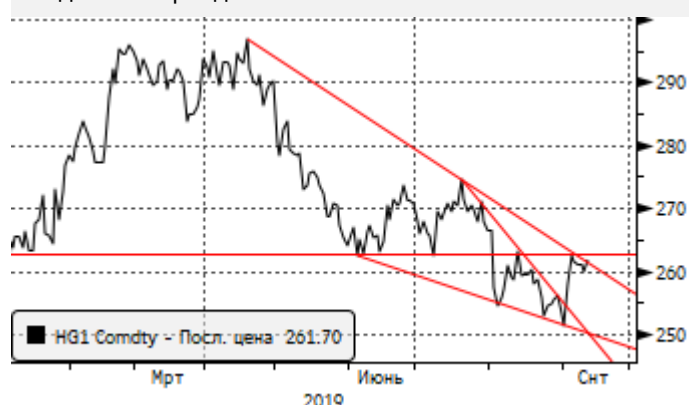
Медь: тест трендовой линии