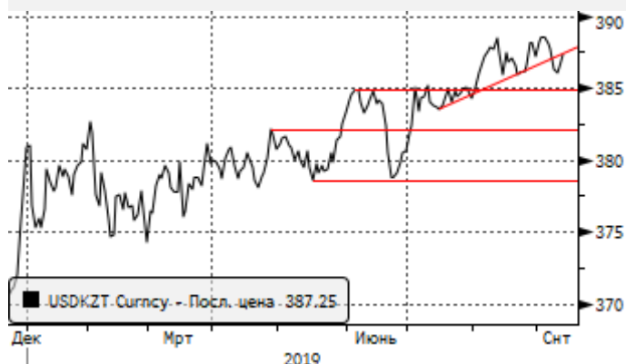
USDKZT: в рамках нового локального аптренда