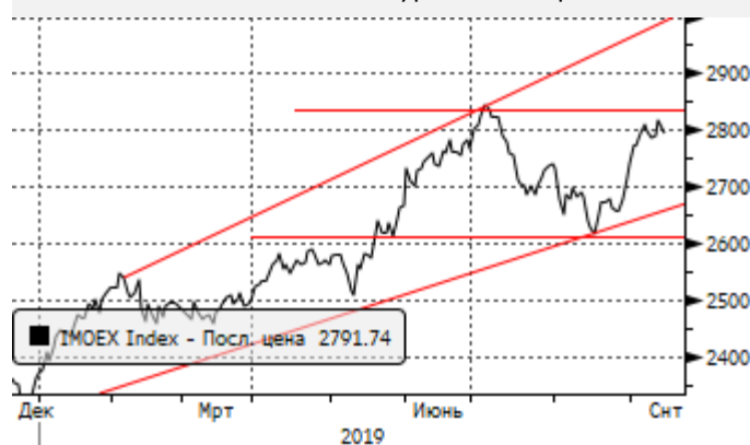
МОЕХ: консолидации близи уровней сопротивления