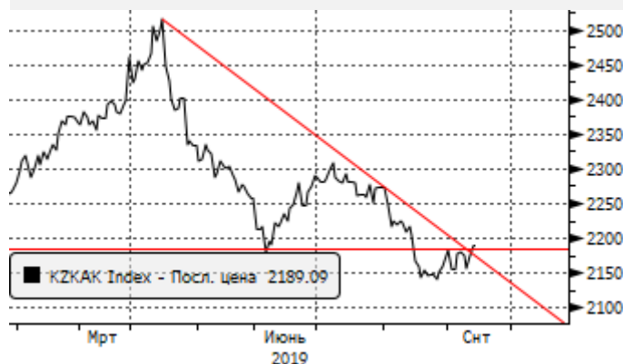
KASE: ретест уровня сопротивления