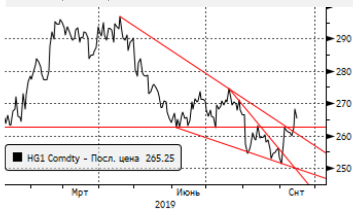
Медь: пробой трендовой линии