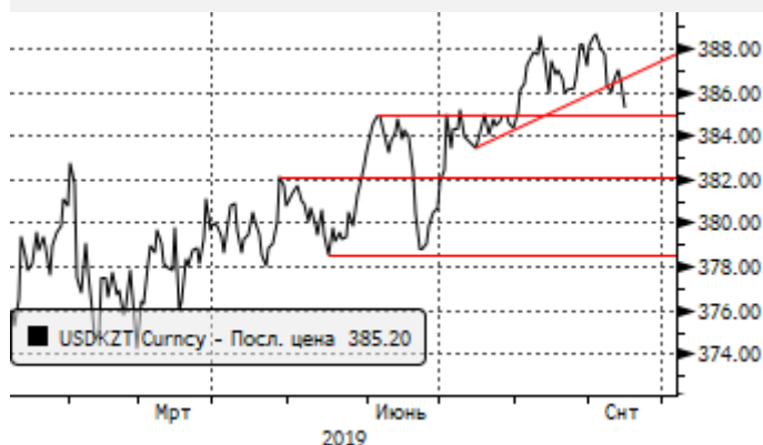
USDKZT: в рамках нового локального аптренда