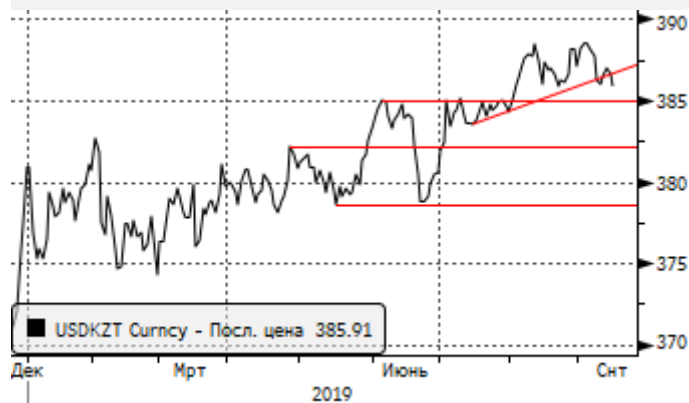
USDKZT: в рамках нового локального аптренда