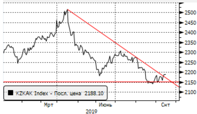
KASE: ретест уровня сопротивления