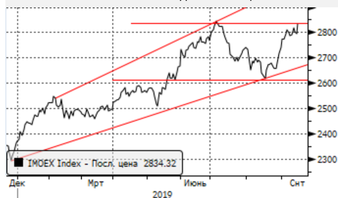
МОЕХ: консолидации близи уровней сопротивления