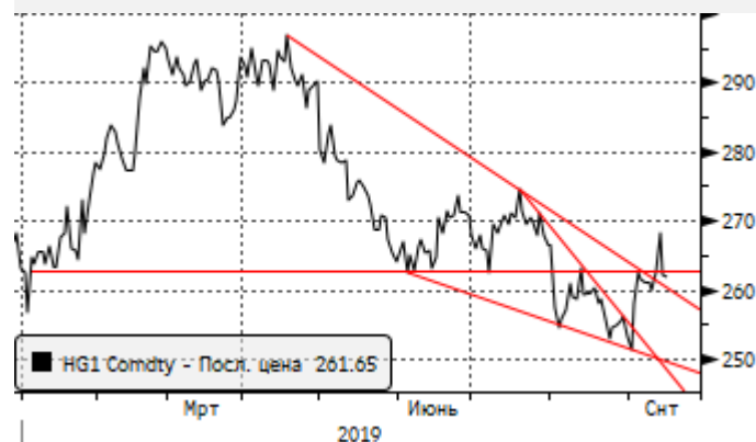
Медь: пробой трендовой линии