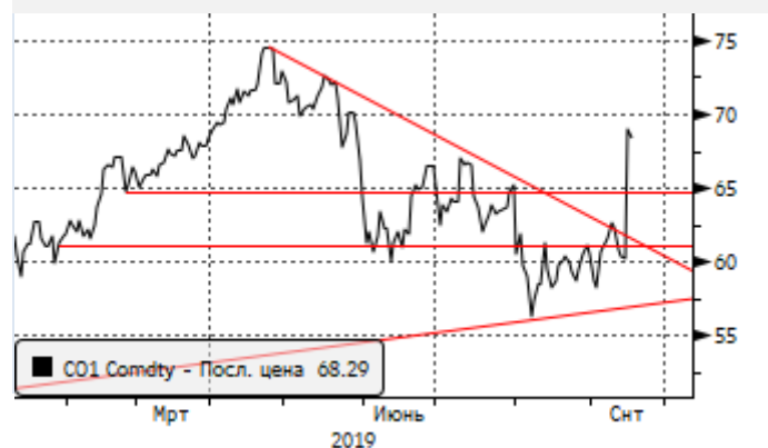
Нефть: резкий рост вверх