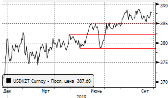
USDKZT: в рамках нового локального аптренда