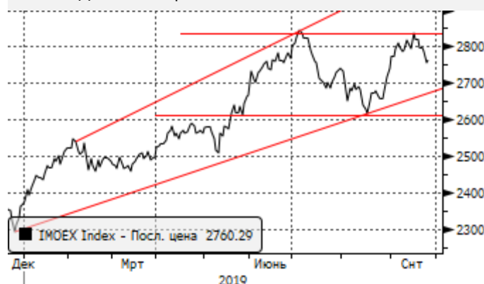
МОЕХ: Двойная вершина