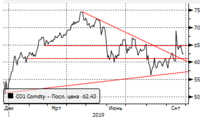
Нефть: возросшая волатильность