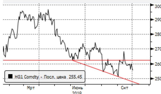
Медь: отскок к 2,61