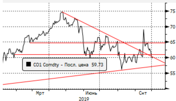
Нефть: возросшая волатильность