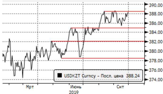
USDKZT: в рамках нового локального аптренда