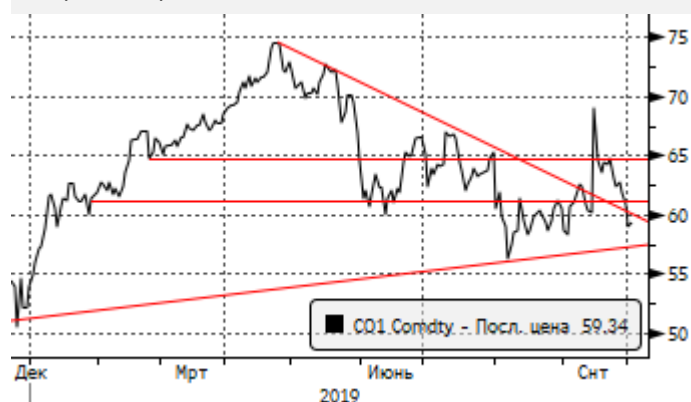
Нефть: возросшая волатильность