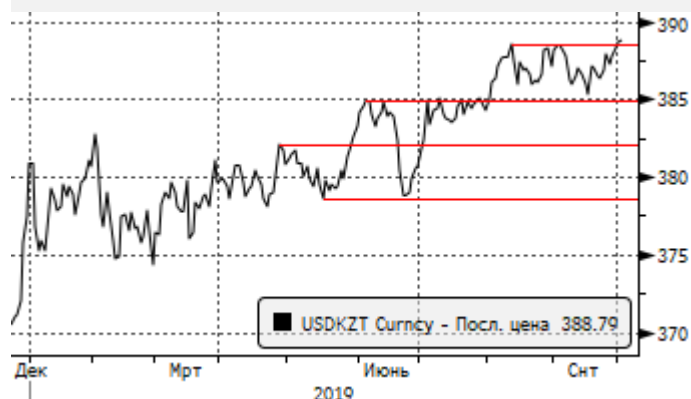
USDKZT: в рамках нового локального аптренда