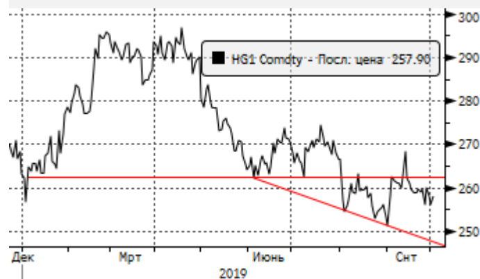
Медь: отскок к 2,61