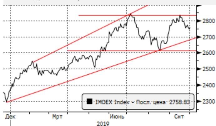
МОЕХ: Двойная вершина