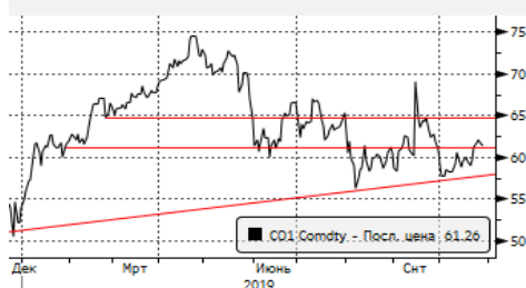
Медь: пробой сопротивления