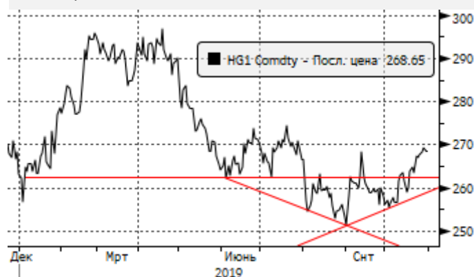
Медь: рост к 2,64