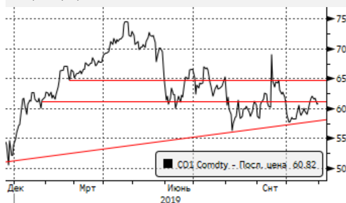
Нефть: у трендовой линии