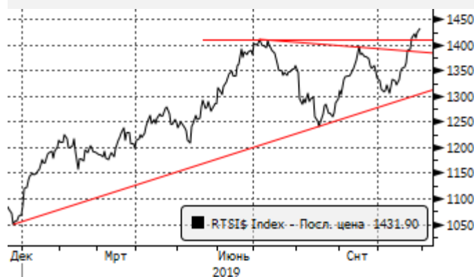
РТС: Тест трендовой и горизонтальной линии