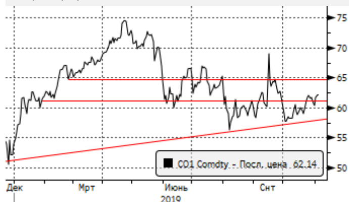
Нефть: у трендовой линии