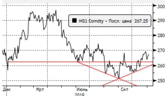
Медь: рост к 2,64