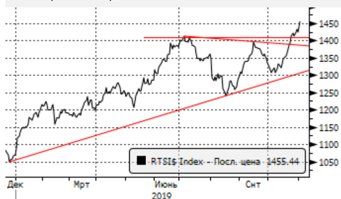
РТС: пробой сопротивления