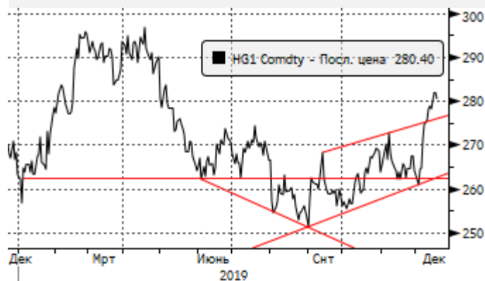
Медь: рост до 2,74