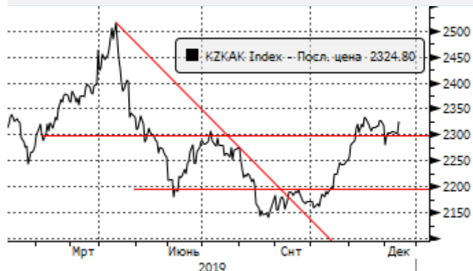
KASE: у отметки 2300 пунктов