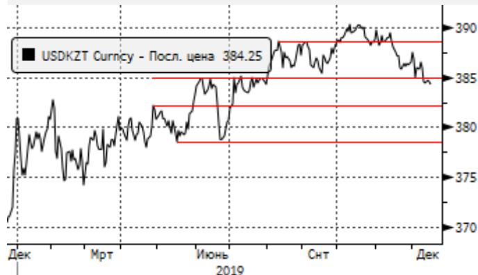
USDKZT: отскок от отметки 385