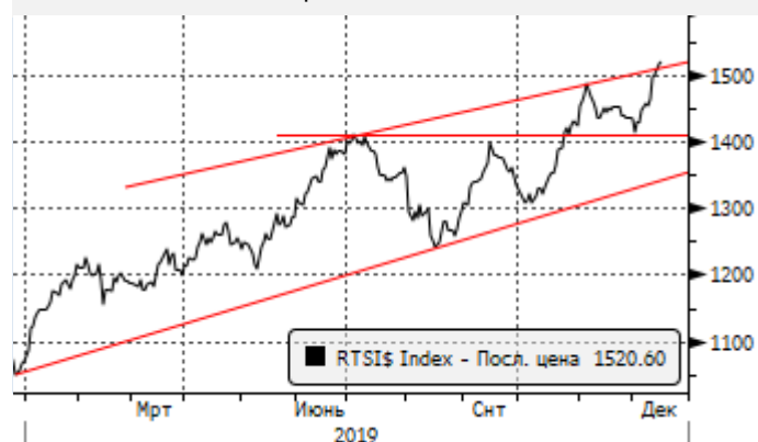
РТС: отскок от поддержки