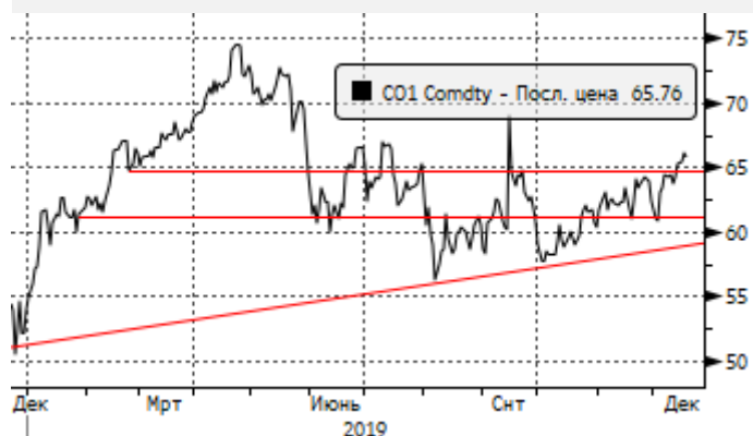
Нефть: у уровня сопротивления