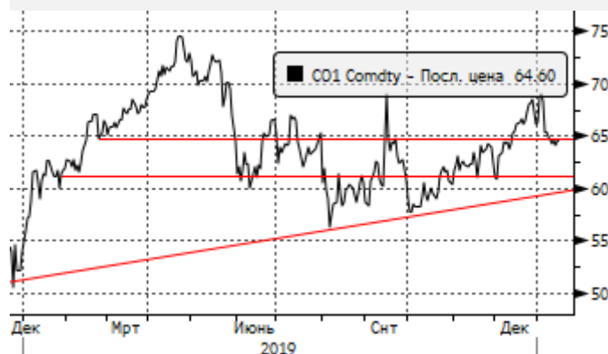
Нефть: пробой уровня сопротивления