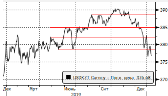
USDKZT: повторное укрепление