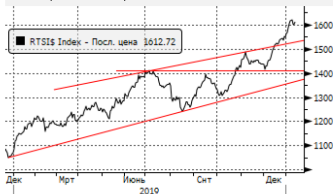
PTC: продолжение ралли