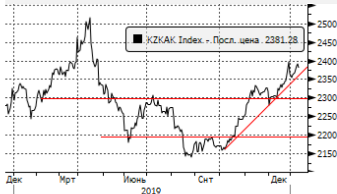
KASE: пробой сопротивления 2340 пунктов