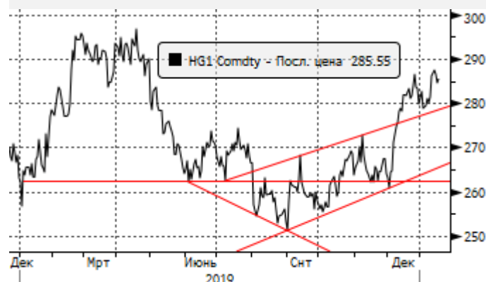
Медь: попытка восстановления