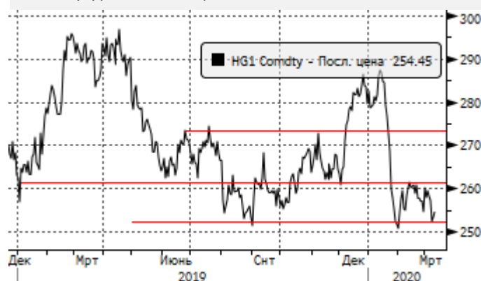
Медь: у уровня поддержки