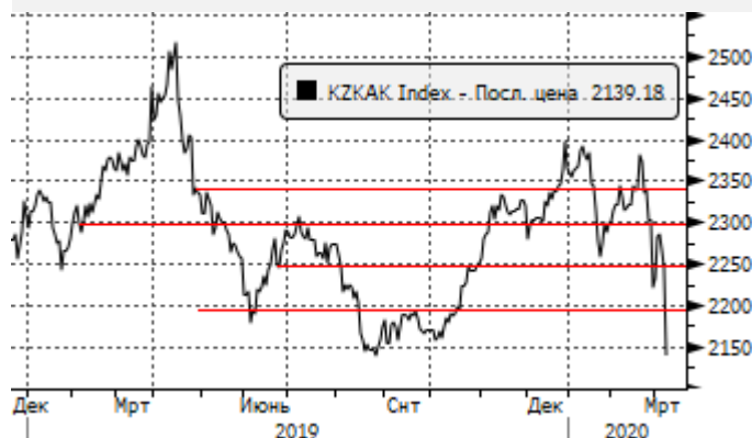
KASE: Снижение к уровню поддержки