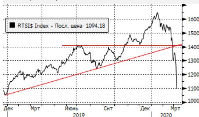
PТС: пробой трендовой линии