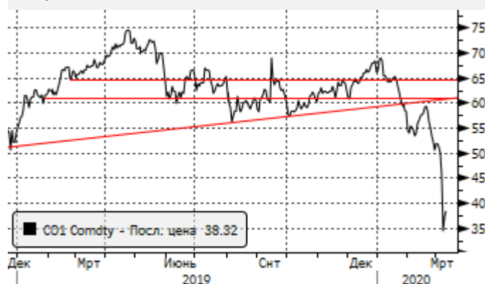
Нефть: небольшой отскок от $32