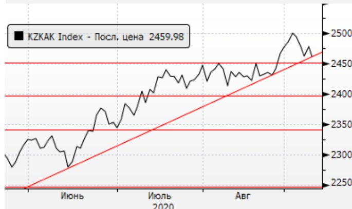
KASE: Снижение к уровню поддержки