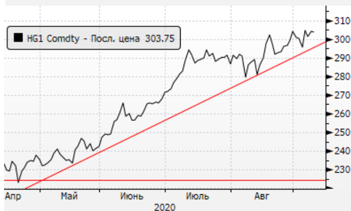
Медь: пробой уровня