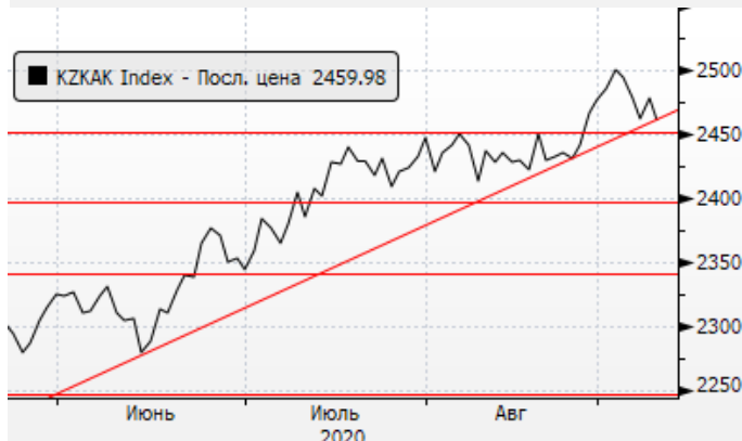
KASE: Снижение к уровню поддержки