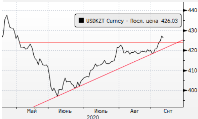
USDKZT: отскок вверх от 376