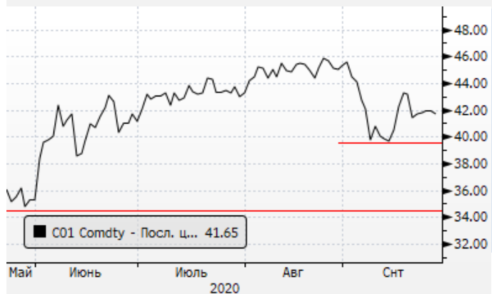
Нефть: торговля в районе $41,5