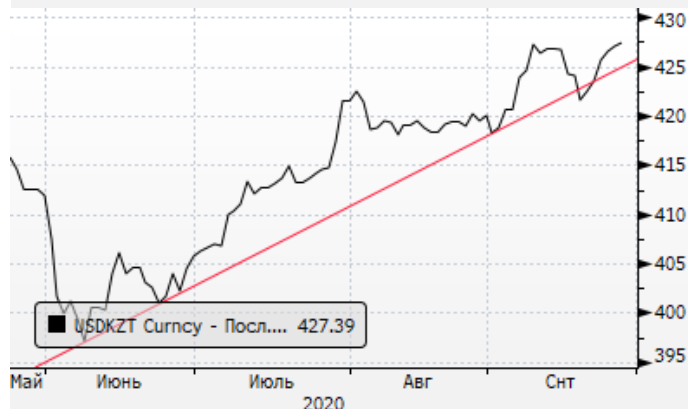
USDKZT: восходящая тренд для доллара