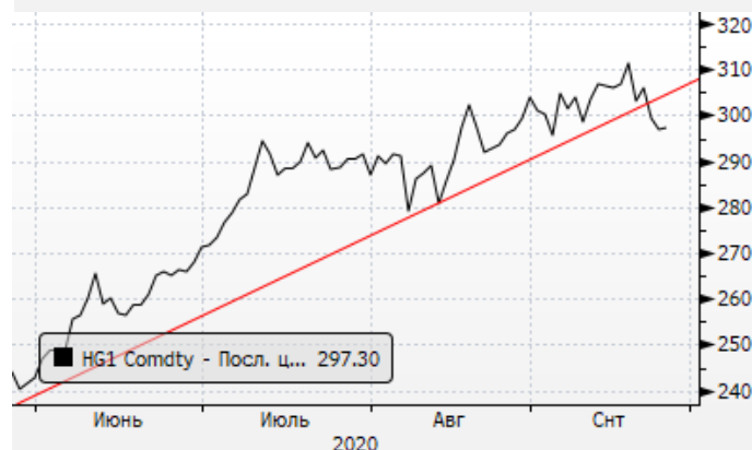
Медь: пробой трендовой линии