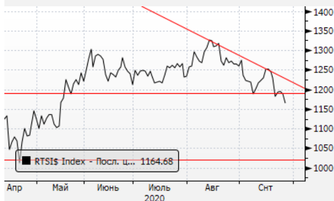
PTC: формирование дивергенции