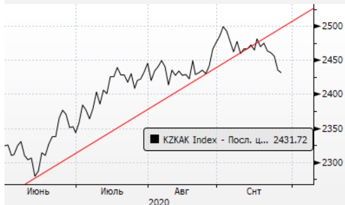
KASE: пробой восходящего тренда