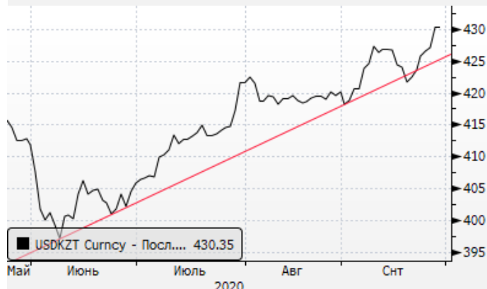
USDKZT: восходящий тренд для доллара