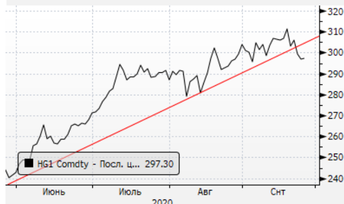
Медь: пробой трендовой линии