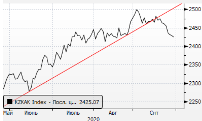
KASE: пробой восходящего тренда