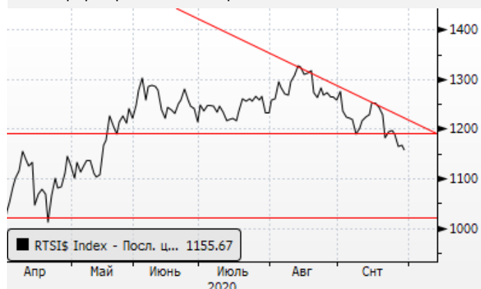
PTC: формирование дивергенции