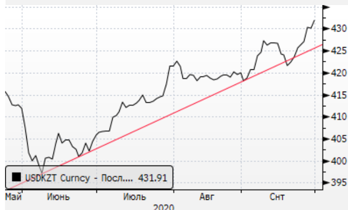
USDKZT: восходящий тренд для доллара