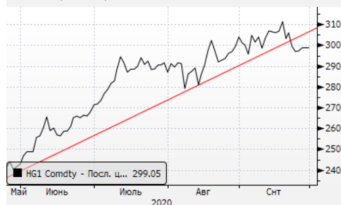
Медь: пробой трендовой линии