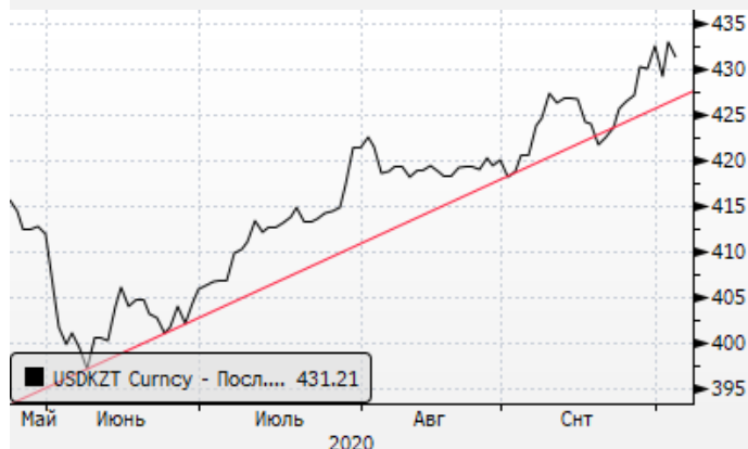
USDKZT: восходящий тренд для доллара