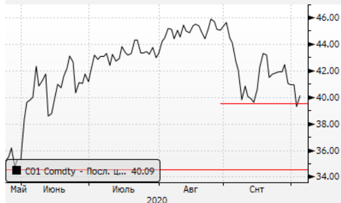
Нефть: отскок от минимумов