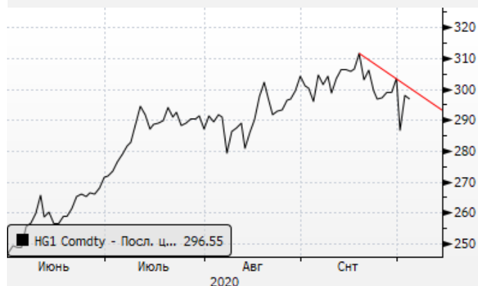
Медь: возросшая волатильность