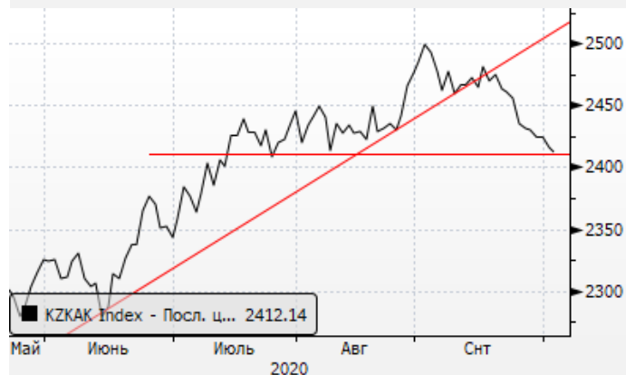
KASE: у уровня поддержки 2410 пунктов