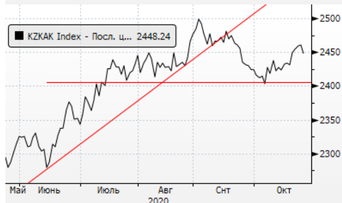
KASE: небольшой откат после роста