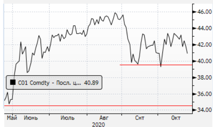
Нефть: Волатильный боковой тренд