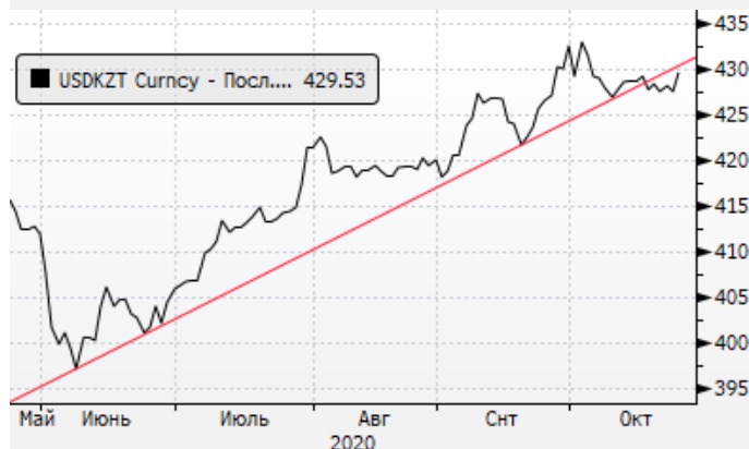
USDKZT: доллар пытается вернуться в растущий тренд