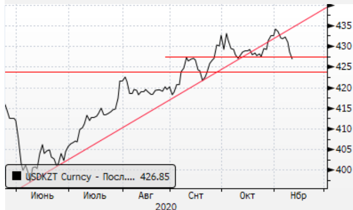
USDKZT: локальное укрепление тенге