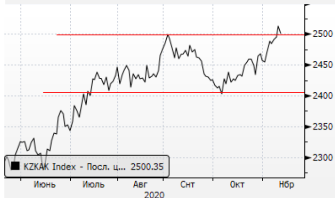
KASE: восстановление индекса