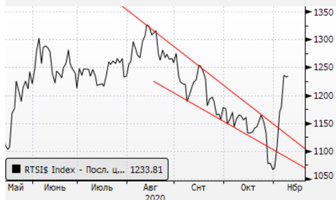
РТС: отскок вместе с нефтью