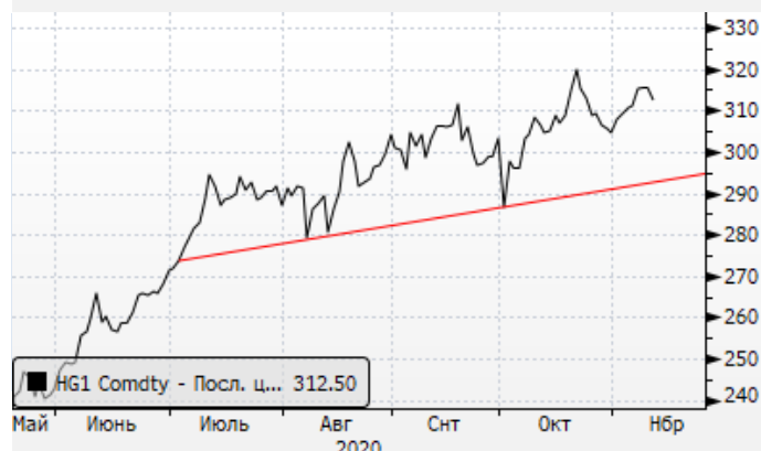
Медь: попытка восстановления