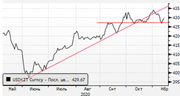
USDKZT: локальное укрепление тенге