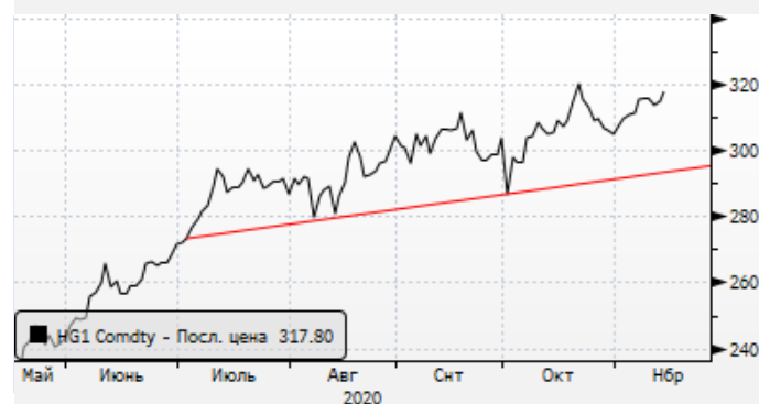
Медь: попытка восстановления