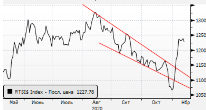
РТС: отскок вместе с нефтью