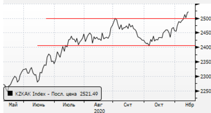
KASE: восстановление индекса