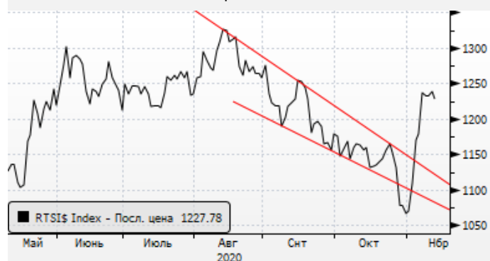
РТС: отскок вместе с нефтью