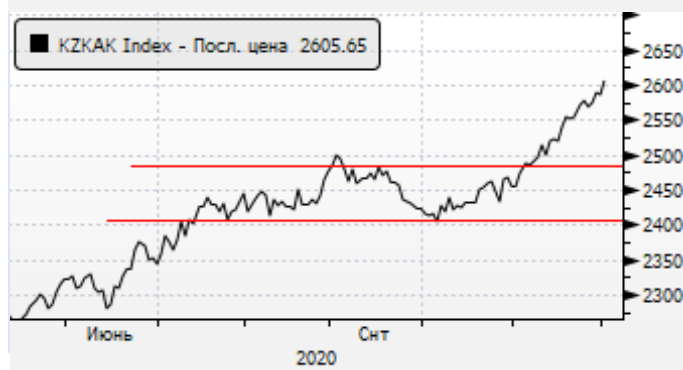
KASE: ралли индекса