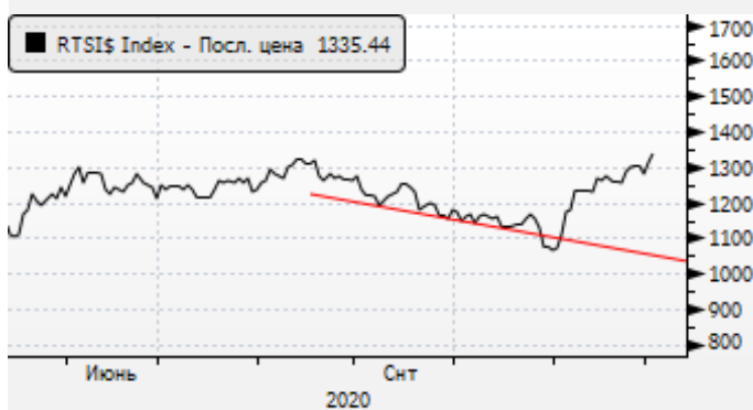
РТС: отскок вместе с нефтью