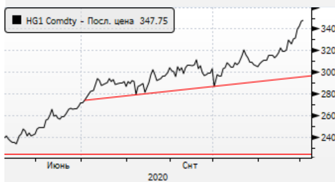
Медь: ралли продолжается