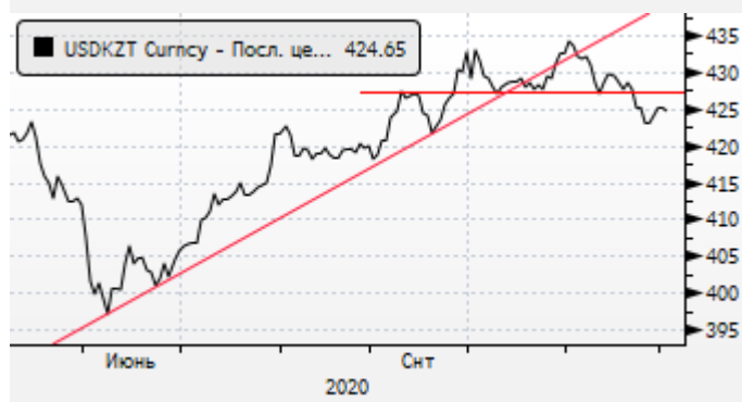
USDKZT: предновогоднее укрепление тенге