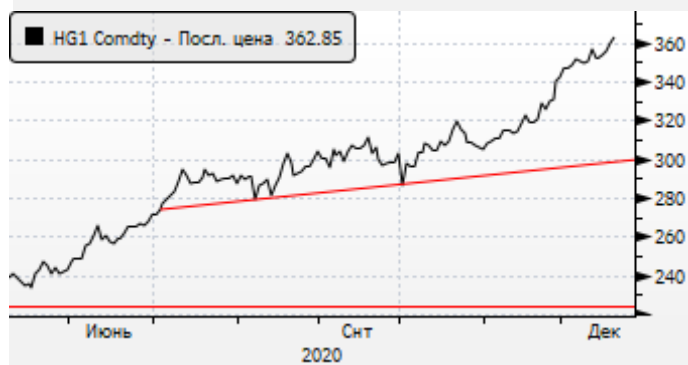
Медь: ралли продолжается