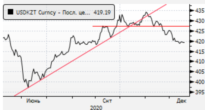
USDKZT: предновогоднее укрепление тенге