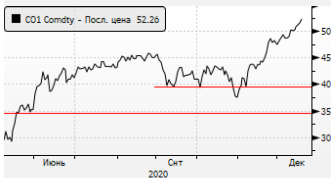
Нефть: отскок цен вверх