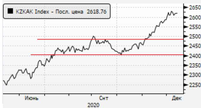
KASE: пауза в ралли