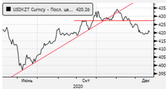
USDKZT: предновогоднее укрепление тенге