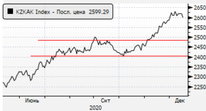
KASE: пауза в ралли