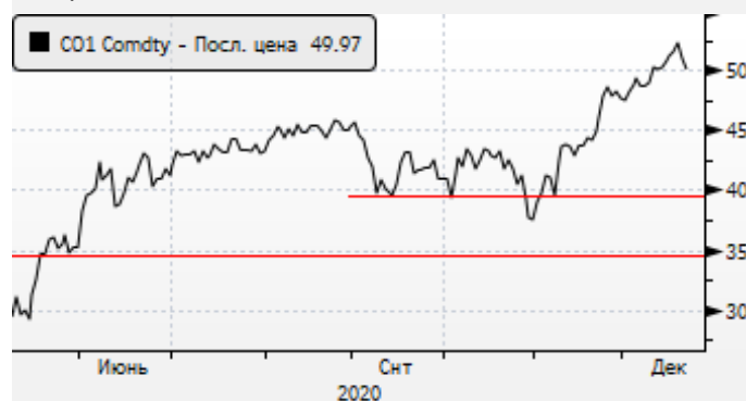
Нефть: отскок цен вниз