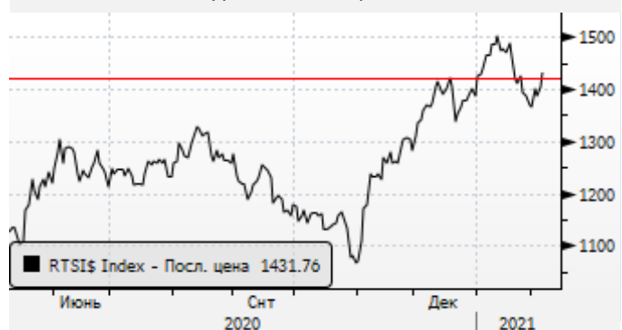
РТС: снижение к уровню поддержки