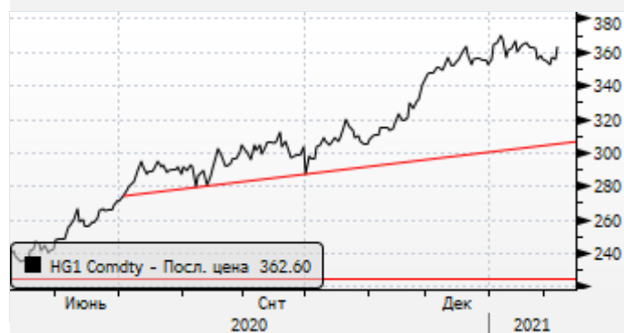
Медь: пауза в ралли