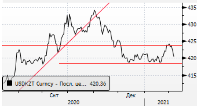
USDKZT: консолидация у отметки 420