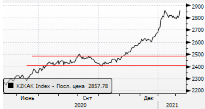
KASE: пауза в ралли