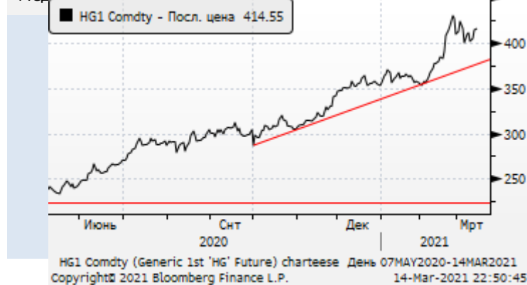
Медь: откат цен с 9-летних максимумов