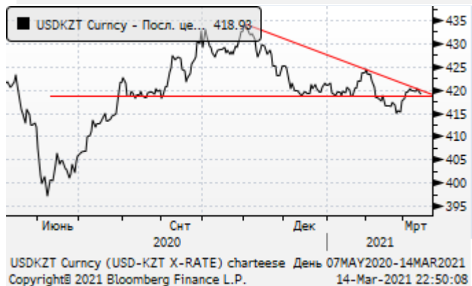
USDKZT: тест трендовой линии