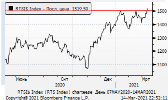
РТС: попытка восстановления