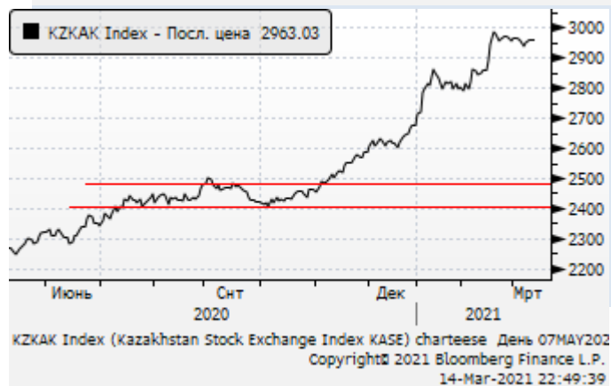
KASE: пауза в ралли