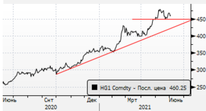
Медь: поддержка 450