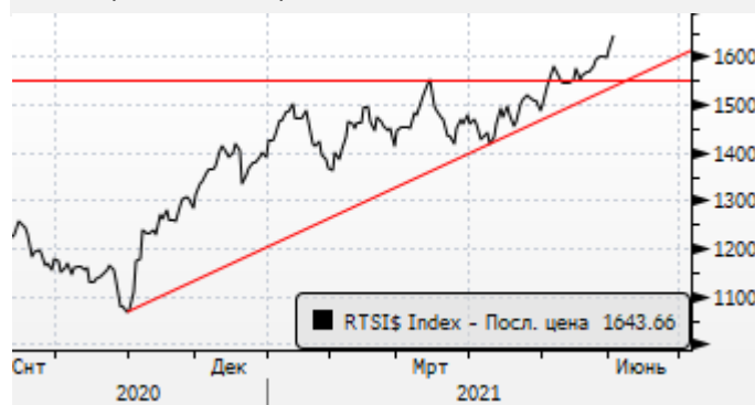
РТС: продолжение ралли