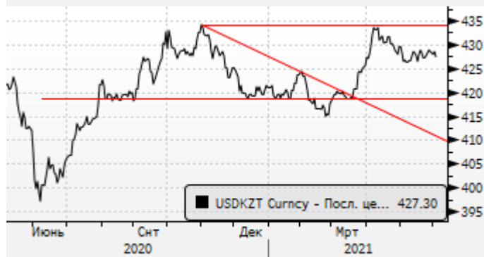
USDKZT: боковой тренд в районе 427-428