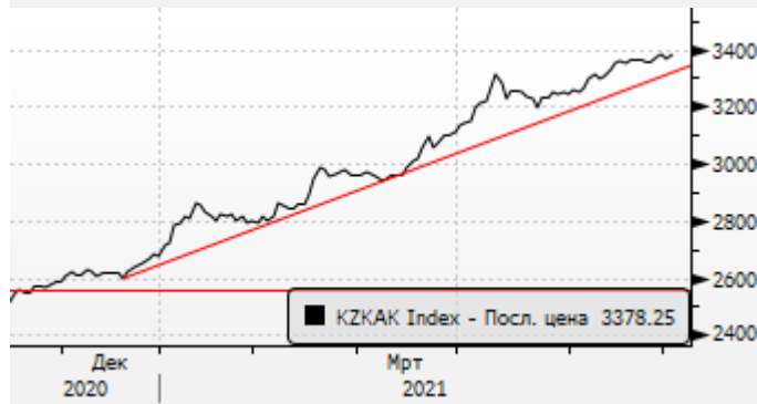
KASE: обновление максимумов