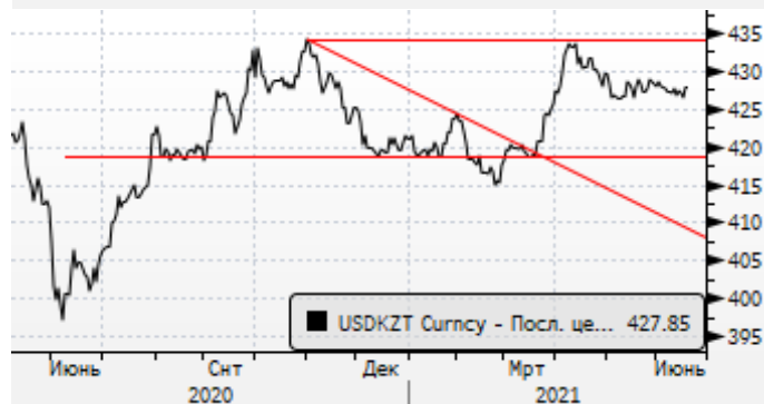
USDKZT: боковой тренд в районе 427-428