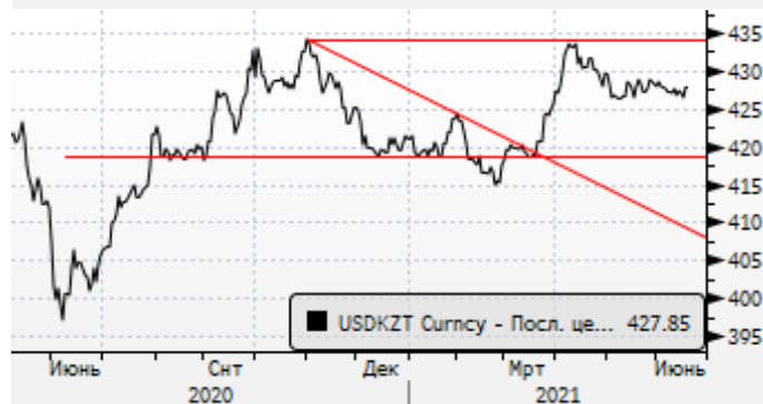
USDKZT: боковой тренд в районе 427-428