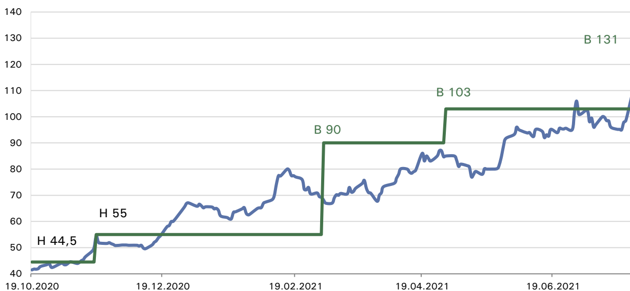
Иллюстрация 2. Предыдущие рекомендаций и целевые цены от Фридом Финанс. (В-«покупать», Н-«держать», S-«продавать»)