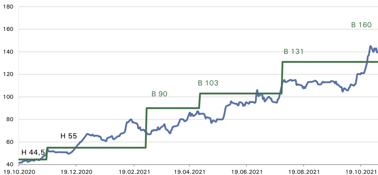
Иллюстрация 2. Предыдущие рекомендаций и целевые цены от Фридом Финанс. (B-«покупать», H-«держать», S-«продавать»)