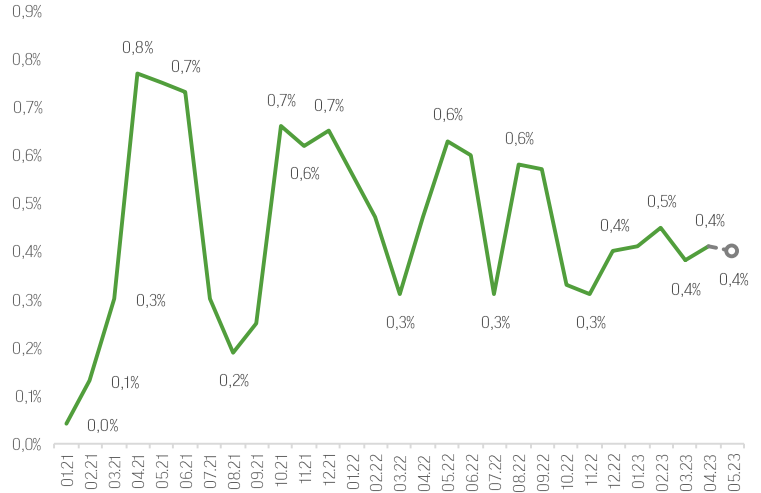
Базовая потребительская инфляция в США м/м (скорректированная на сезонность), %