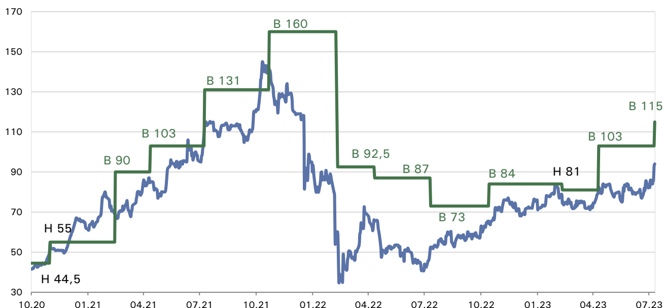
Иллюстрация 2. Предыдущие рекомендаций и целевые цены от Freedom Broker. (B-«покупать», H-«держат», S-«продавать»)