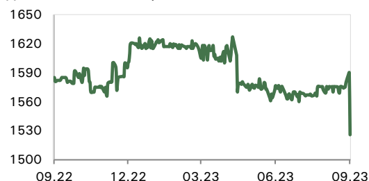
Динамика акций / биржа KEGC/KASE